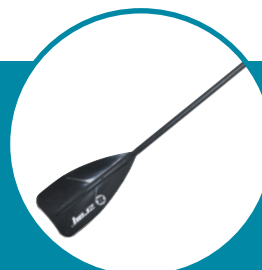
pagaie 3 sections 165 - 215cm