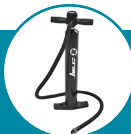
Pompe haute pression