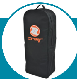
Sac de transport