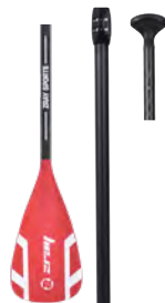
Paleta de aluminio Elite