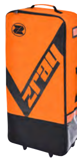
Bolsa de transporte Premium