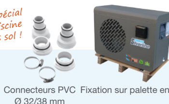
Connecteurs PVC Ø 32/38 mm