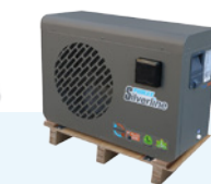
Fixation sur palette en bois